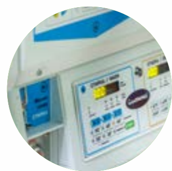
профессиональный подход к чистке белья