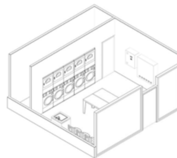
Схема расположения оборудования в объеме